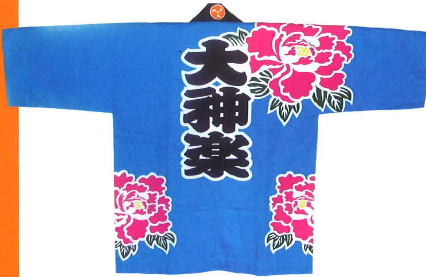
Hand-dyed Garments by Ito Dye Factory Co., Ltd