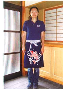
Traditional homaekake (apron) with hand-dyed koi (Japanese carp). / 帆前掛け。裏側からも模様がくっきり見えます。