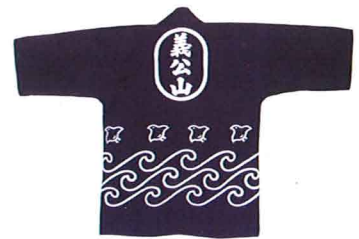
A hand-dyed hanten coat for summer festivals. / 同じ染め方で夏祭りの祥天もつくっています。