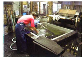
The workshop where the garments are dyed by hand using traditional methods. / 糊を洗い落とすと、紺地に模様が浮き上がります。